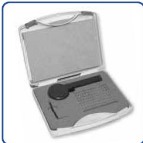
(Die Lieferung erfolgt im Aufbewahrungskoffer aus stabilem Kunststoff)